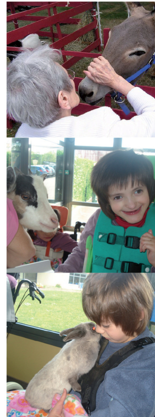
l'âne médiateur en interaction avec une résidente

Les ateliers proposés à l'extérieur sont le nourrissage des lapins, des chèvres, le brossage des chiens, le pansage de l'ânesse, de la ponette ; il est possible de promener les chiens et l'ânesse en longe, ou de suivre un parcours de maniabilité en dirigeant l'animal à travers les différents obstacles.