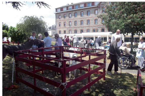
Présence de la ferme dans l'institution

« Le personnel encadrant de la structure d'accueil est toujours associé aux activités »